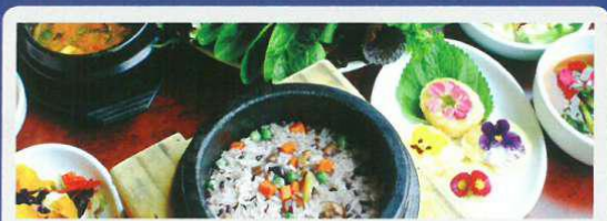
Korea auf der IMEX in Frankfurt

Vorerst wurde die Location unter anderem als Speisesaal für die Delegierten des koreanischen Roten Kreuzes genutzt und erfreute sich als Filmlocation für zahlreiche Blockbuster großer Beliebtheit. Bestehend aus insgesamt sechs konventionellen Wohnhäusern, den sogenannten Hanoks, eignet sich Samcheonggak für eine Bandbreite von kleineren Veranstaltungen wie Seminare, Bankette oder Workshops. Im größten Hanok namens „Ilhwadang“ finden bis zu 200 Personen bei einem Stehempfang Platz. Zusätzlich bietet ein groß angelegter Garten die Möglichkeit für Events im Freien. In einem Umkreis von wenigen Kilometern liegen zahlreiche Hotels sowie Sehenswürdigkeiten wie Tempel und Museen, die sich für die Gestaltung von Rahmenprogrammen anbieten.