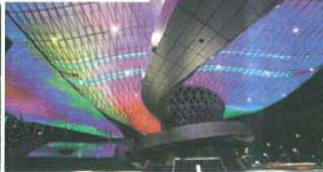
Nurimaru APEC House